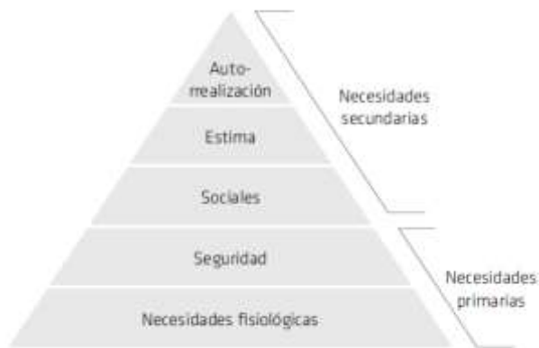
Figura 4 Jerarquía de las necesidades de Maslow